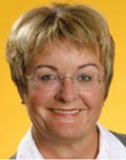
Dorothea Henzler Minister ds. Oświaty Hesji