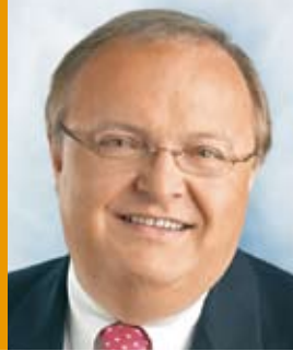
Jürgen Banzer Ministar Hesena za rad, porodicu i zdravstvo

Trenutno se sve više probija saznanje, da u ranom dečjem obrazovanju leže posebne prilike za razvoj. Nije ni čudo: razvojno-psihološka, neuro-naučna i pedagoška istraživanja značajno se slažu u mišljenju da su prvih deset godina života najintenzivnije za učenje u čitavom životu čoveka. Znači, učenje ne počinje tek polaskom u dečji vrtić ili osnovnu školu, već mnogo ranije, sa rođenjem. Novi pristupi u istraživanju pritom jasno pokazuju da partnerstvo u obrazovanju i vaspitanju, posebno pri oblikovanju prelaza - prilikom prelaza deteta u dečju dnevnu ustanovu i iz dečje dnevne ustanove u osnovnu školu - igraju važnu ulogu.