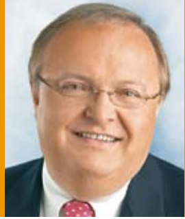
Jürgen Banzer Hessen Eyaleti İş, Aile ve Sağlık Bakanı

Günümüzde, erken çocukluk eğitiminin çocuğun gelişimi için önemli katkılar sağladığına dair giderek daha fazla bilgi edinilmektedir. Bu bir sürpriz değil: Gelişim psikolojisi, nörobilimsel araştırmalar ve pedagoji araştırmalarının sonuçları insan hayatının ilk on yılının, tüm yaşamı boyunca hiç olmadığı kadar öğrenme yoğunluğuna sahip bir dönem olduğu gerçeği konusunda ilginç bir şekilde birleşmektedir. Yani öğrenme, çocuğun ana-