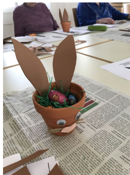
Osterbasteln am 28.03.2023

Nähere Infos hierzu: freitags von 10:00 Uhr -12:00 Uhr im Seniorenbüro (Tel. 06150-4001015)