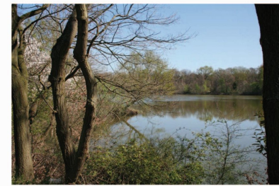
Steinrodsee Der etwa 5 Hektar große Steinrodsee bietet zahlreiche Naherholungsmöglichkeiten. Campingplatz, Gastronomie, Vereinsgelände, Grillhütte, Beachvolleyballfeld, Liegewiesen und Spazierwege rund um den See laden zum Entspannen ein. Baden ist allerdings nicht erlaubt, im See vermehren sich gelegentlich gesundheitschädliche Algen. Das Gewässer ist an den Angelverein Gräfenhausen verpachtet, der den See in Kooperation mit der Stadt Weiterstadt betreut und sich um die Ansiedlung der Fische kümmert. Die beeindruckenden Karpfen kann man gut von der Terrasse des Vereinslokals „Fischerhütte“ beobachten. Beim Rundgang um den See ist auch der idyllische Verlauf des Apfelbachs zu erkennen, der sich auf der östlichen Seite entlang schlängelt. Rund um den See herrscht Anlempflicht für Hunde.